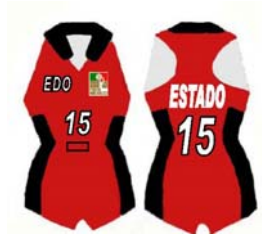
FRENTE Y ESPALDA